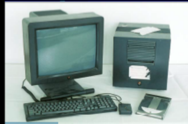
↑ Premier serveur WWW @ CERN